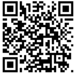
かわうち ちず 川内キャンパス地図QRコード