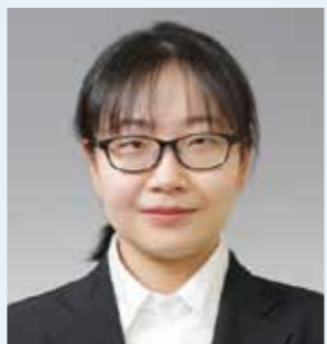
東北学院大学 経済学部

DATEntre プログラムを通じ、県内トップクラスの学生たちとの交流や、一緒に授業を受けたことで刺激を受け、自分のコミュニケーション能力の向上を実感することができました。就職活動で苦労したのは言葉の壁、国籍、1 度の技能実習の経験が新卒とみなされない場合があったことなど様々です。自分にとってベストだと思う選択をして、長い目で自分のキャリアを考えることが鍵だと思います。