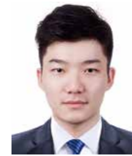
東北大学 経済学研究科

本当に DATEntre プログラムに参加してよかったと思います。役に立ったことは数え切れません。入手できる就職の情報が増えたこと、奨励費の制度が活用できたこと、さらに ES の指導を受けられたことが書類選考にとても役立ちました。就職活動と修士論文提出の時期が重なり両立するのが大変でした。最終面接で OBOG 訪問をしたか、という質問が頻りに出たので、今後就職活動される方参考にして下さい。