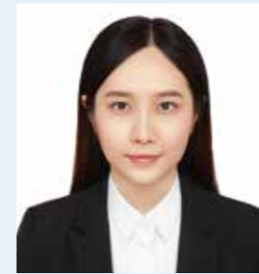
東北大学 文学研究科

DATEntre プログラムの、ビジネス日本語や日本の産業社会についての授業はとても勉強になり、特に東北地方の企業・社会状況を知るきっかけになりました。日本の就職活動は長期にわたるので大変でしたが、事務局の推薦により奨学金を受給し、経済面でのストレスを大きく軽減することもできました。就職活動中はエントリーシートの修正や個別相談など、DATEntre の先生に大変お世話になりました。