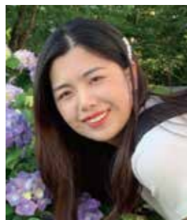
東北大学 教育学研究科

約 1 年間の就職活動を振り返ると、最も難しかったのは自己分析とエントリーシートの作成です。DATEntre プログラムを通じて先生から色々支援をいただき、各種就職対策講座や企業合同説明会、面談の指導などのサポートを受けました。最も参加してよかったと思うのは、諦めようと思った時、続けていく力をもらった点です。これから就職活動をするみなさん、DATEntre を利用して頑張ってください。