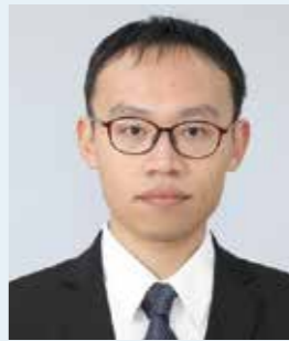
東北福祉大学 総合マネジメント学部

日本での就職を具体的に考える際の選択の手がかりとしてプログラムに参加しました。就職活動で大変だったことは、自分に合う職種を見つけること、どなたかところで働きたいのかを決めることでした。自己分析や企業リサーチにも苦戦した中で、無事に就職できたのは DATEntre の一員だったことが大きいと思います。特にビジネス場面で使う日本語はここで勉強したことが、面接などで直ぐ役立ちました。