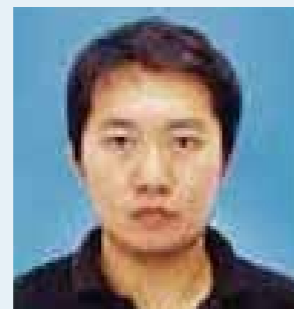
東北福祉大学 総合マネジメント学部

DATEntre プログラムに参加し役立ったことは、奨学金とインターンシップ先の紹介です。就職活動では手書きの履歴書を書くのが大変でした。実際に行動する中で、インターンシップとコミュニケーション能力が一番重要だと感じました。自分の就職したい分野を早めに決めて、3 年生の夏からその分野のインターンシップにできるだけたくさん参加することをおすすめします。