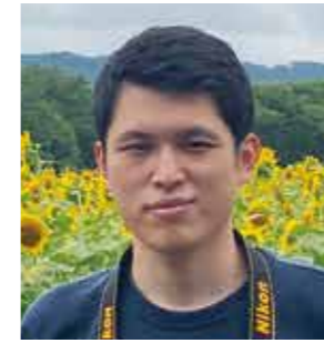
東北大学 工学研究科

DATEntre プログラムに参加しよかったことは、エントリーシートの添削と、自分と同じように日本で就職を考える学生と出会ったことです。互いに応援し合い、就職に関する情報の共有ができました。就職活動で一番大変だったのは面接で、質問に答えられない不安を解消するため、想定される質問を事前に書き出し何度も練習しました。これから就職活動をするみなさん、自分を信じて頑張ってください。